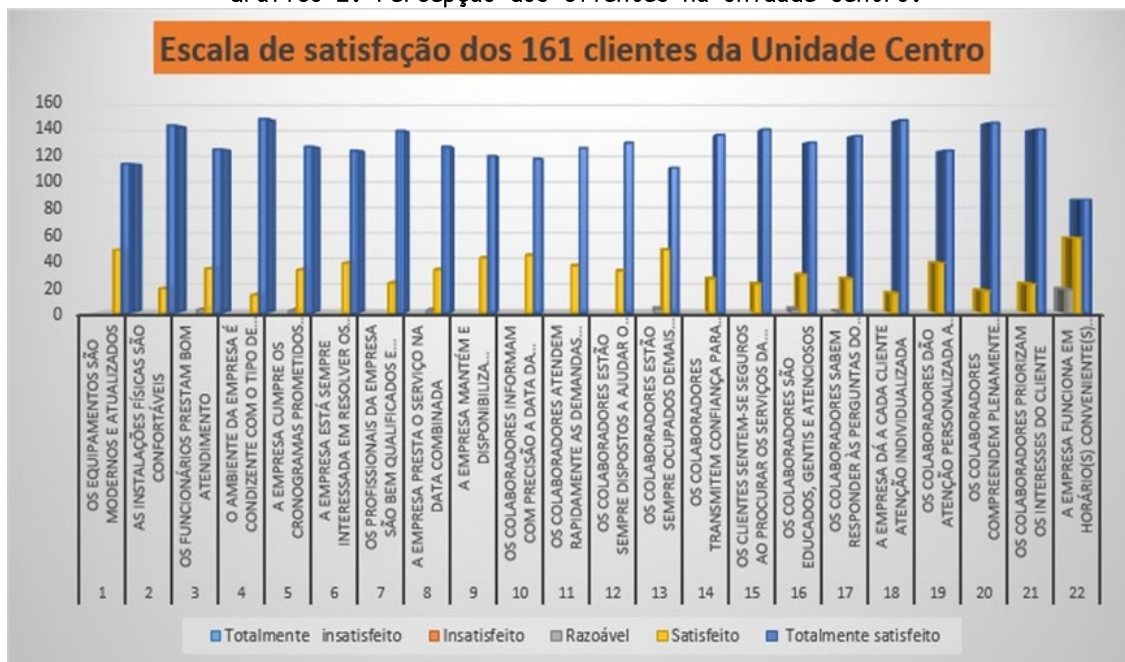
Gráfico 2: Percepção dos clientes na Unidade Centro.

Dos 161 clientes pesquisados em relação à qualidade do atendimento e dos serviços prestados pela empresa RADSON – Diagnóstico por Imagem de Santa Cruz do Sul, Unidade Centro, a escala mostra um índice bastante Elevado de clientes respondendo que estavam Totalmente satisfeitos, conforme é possível de ser observado no Gráfico 2.