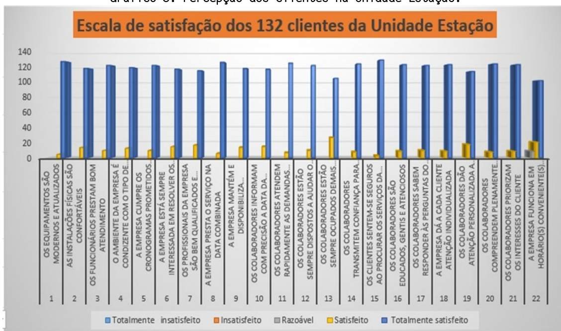
Gráfico 3: Percepção dos clientes na Unidade Estação.

Na Unidade Estação da empresa RADSON - Diagnóstico por Imagem de Santa Cruz do Sul, foram 132 clientes pesquisados em relação à qualidade do atendimento e dos serviços prestados. Chama a atenção o elevado índice de satisfação, algo que pode ser visto como bastante positivo para a empresa. Nota-se nos números apresentados no Gráfico 3, a seguir, um elevado registro de respostas totalmente satisfatórias, à medida que não se constatou nenhum índice de neutralidade, tampouco de insatisfação.