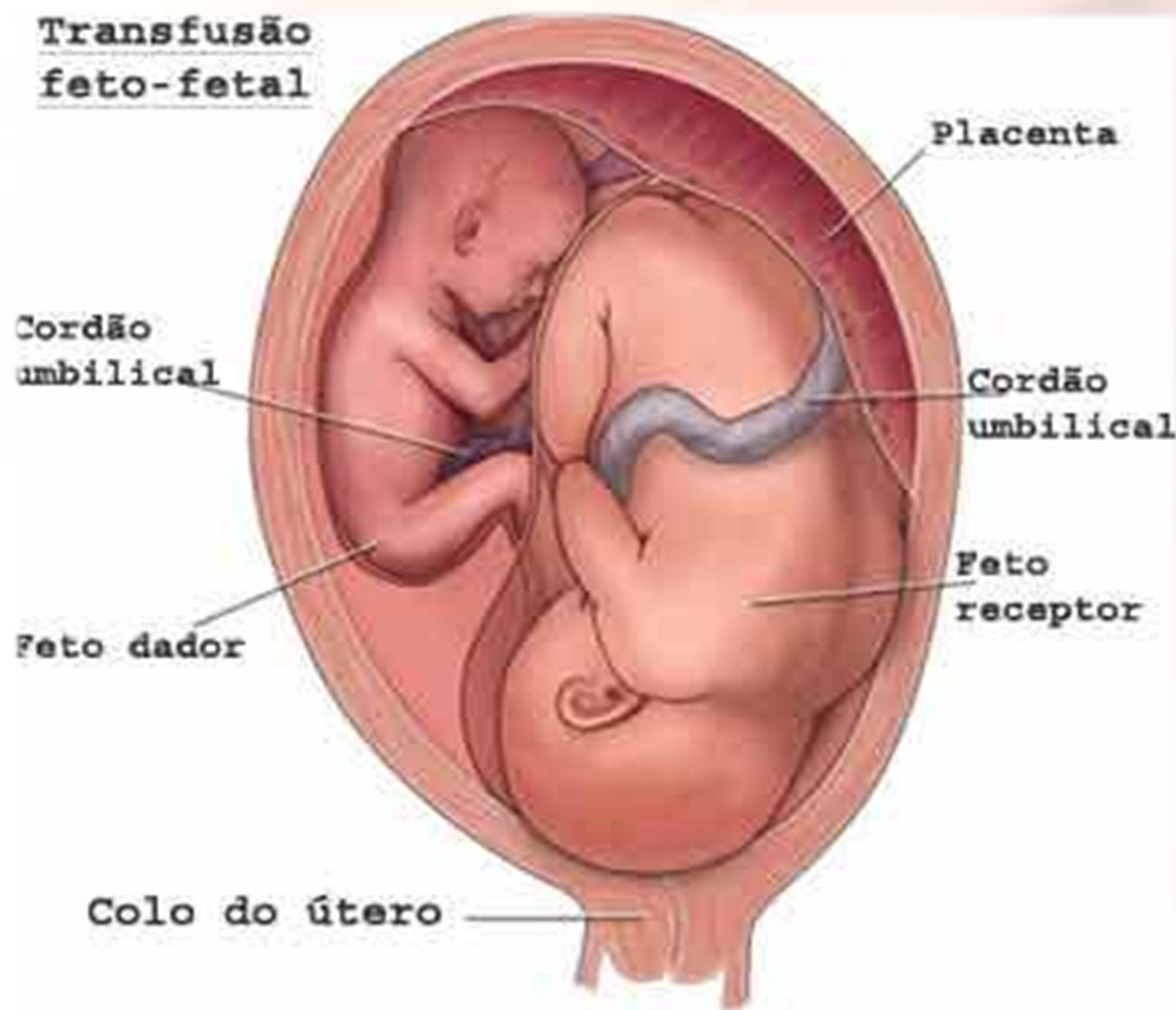
Figura 1 – Síndrome da transfusão feto-fetal

O método utilizado para obtenção dos dados foi de referência bibliográfica para análise dos riscos em gravidezes múltiplas. Através da Bireme, pelos descritores Gravidez Múltipla e Gravidez de Alto Risco, e pelo Google, com as palavras-chaves Gravidez Múltipla, Gestação Gemelar e Riscos na Gravidez Múltipla.